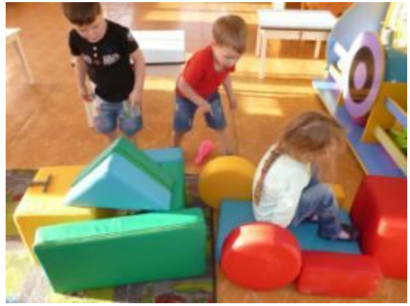
Играли в сюжетно - ролевую игру «В автобусе»