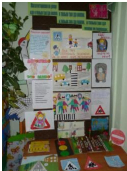
«Я прилежный пешеход».