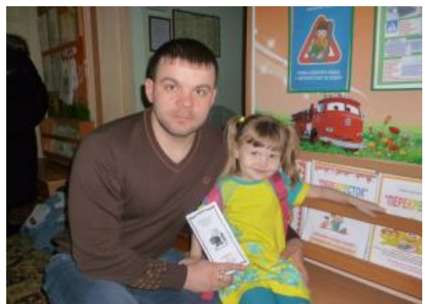
После анкетирования родители задумались, правильно ли они выполняют свои обязанности, чтобы оградить ребёнка от опасности на дороге