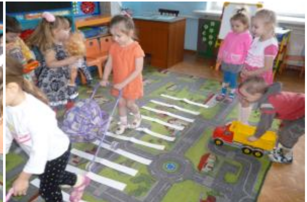
Родители получили памятки «Грамотный пешеход»