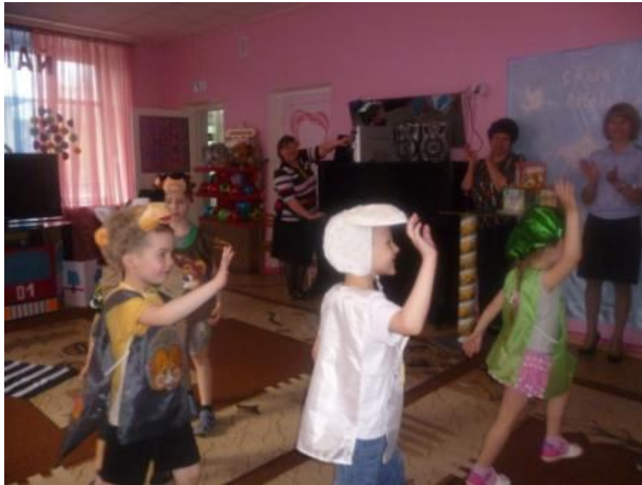
Педагоги ДОУ приняли участие и по поддержали Детскую декларацию по ПДД,