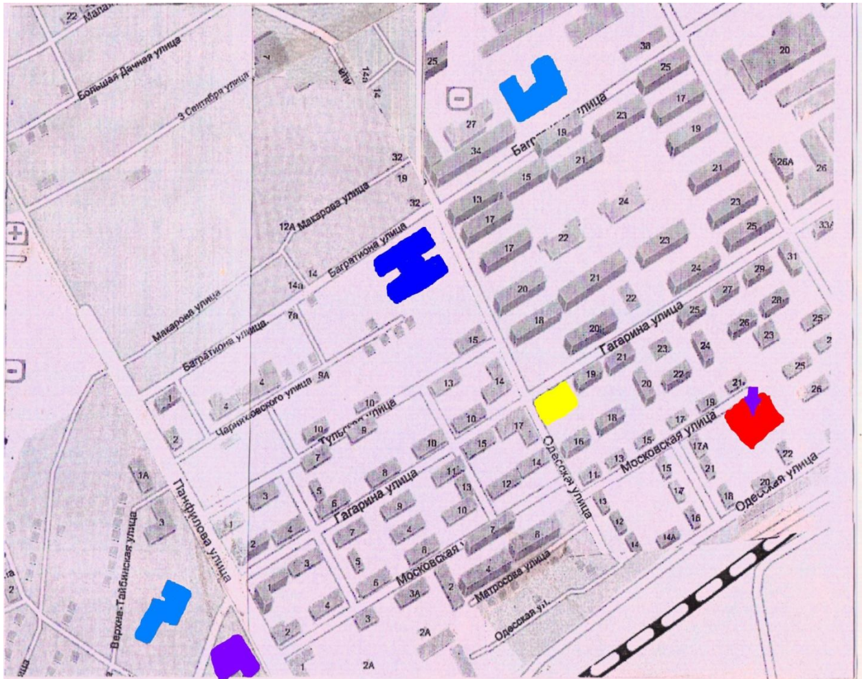
Схема безопасного движения воспитанников МБДОУ детский сад № 8